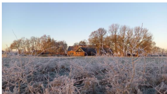
Zencentrum Noorder Poort