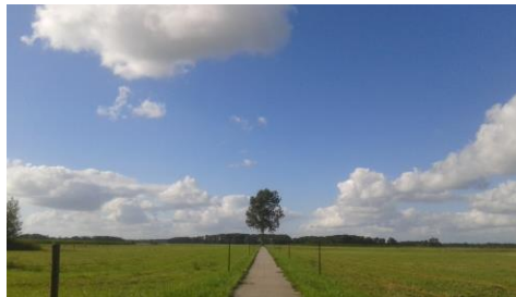
Wandelpad bij Zencentrum Noorder Poort

D. De prijzen voor het verblijf zijn inclusief koffie, thee en vegetarische maaltijden. Dekbedden, kussens, beddegoed en handdoeken worden verstrekt door het centrum (of het pension).