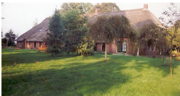
Zencentrum Noorder Poort

D. De prijzen voor het verblijf zijn inclusief koffie, thee en vegetarische maaltijden. Dekbedden, kussens, beddegoed en handdoeken worden verstrekt door het centrum (of het pension).