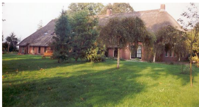
Zentrum Noorder Poort

D. De prijzen voor het verblijf zijn inclusief koffie, thee en vegetarische maaltijden. Dekbedden, kussens, beddegoed en handdoeken worden verstrekt door het centrum (of het pension).